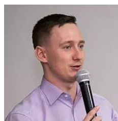
Руководитель региональных программ и проектов Бизнес- инкубатора НИУ ВШЭ, Федеральный эксперт Федарального агентства по делам молодежи РФ, эксперт Всероссийской программы "IT- STAR", предприниматель