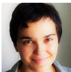
К. п.н., доцент кафедры экономики и управления в негосударственных некоммерческих организациях Департамента государственного и муниципального управления НИУ ВШЭ