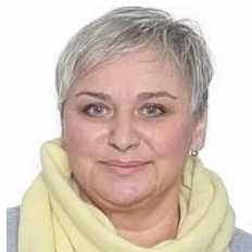
Дипломат и общественный деятель, политолог, генеральный директор ООО «Институт политических исследований», депутат Государственной Думы РФ 5-го созыва, член Общественной палаты РФ, доверенное лицо Президента РФ В. В. Путина.