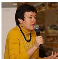
Д. полит.н., доцент кафедры социологии и психологии политики факультета политологии МГУ им. М. В. Ломоносова, Член Российского общества политологов.