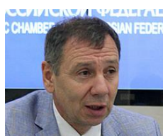
Марков Сергей Александрович

Дипломат и общественный деятель, политолог, генеральный директор ООО «Институт политических исследований», депутат Государственной Думы РФ 5-го созыва, член Общественной палаты РФ, доверенное лицо Президента РФ В. В. Путина.