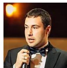
Дипломат с опытом работы в Центральном аппарате МИД России, в составе Миссии БДИПЧ ОБСЕ на президентских выборах в Азербайджане (2008г.), Украине (2010г.)