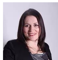
К.псих.н., доцент кафедры акмеологии и психологии профессиональной деятельности Института общественных наук РАНХиГС, директор центра карьерного сопровождения гос. служащих факультета оценки и развития