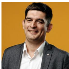
Первый заместитель председателя правительства Удмуртской Республики